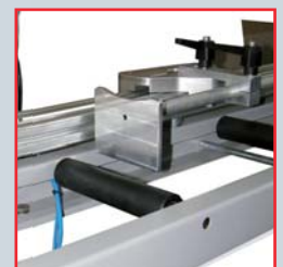
TOPE DE MEDICION